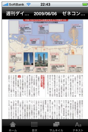
1 ページを表示した場合