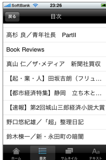
目次ボタンを押した場合