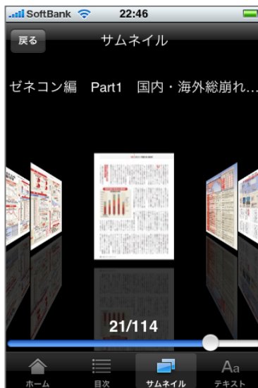
サムネイルボタンを押した場合