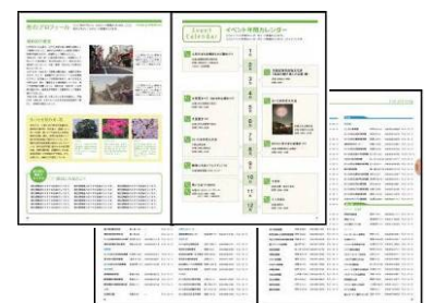
情報リストページ